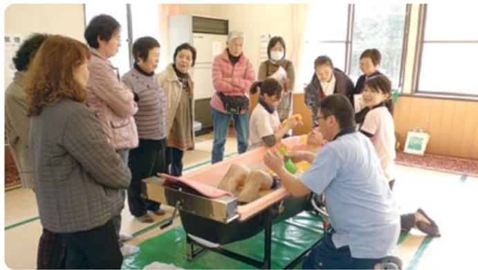
▲平成27年1月30日 「在宅でここまでできる！～訪問入浴サービスの実演～」 講師：アサヒサンクリーン株式会社