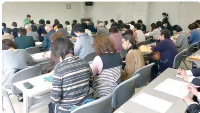
▲平成10月29日・11月6日 「城南町にある介護施設の施設職員による地域の方向けのはなし」 ※各施設より紹介