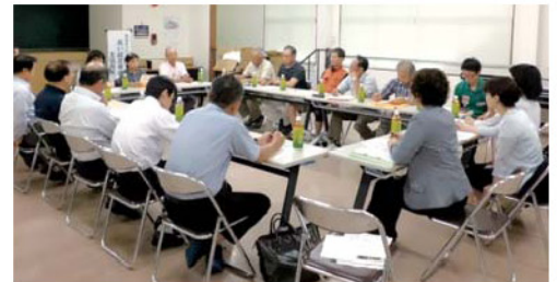
▲ 関係者で集まって、何度も話し合いをしました。

また、南区役所福祉課・保健子ども課や城南交番、当センターの母体法人である熊本市社会福祉協議会もこの活動に協賛しています。